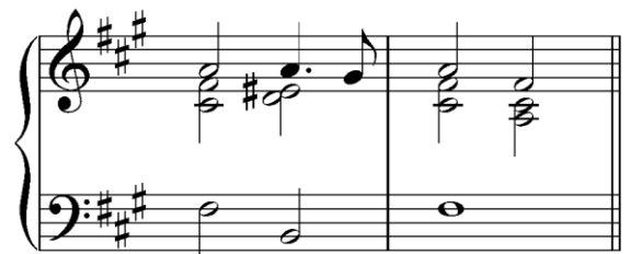
Транспонирующая вниз на б.2