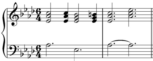
Транспонирующая вверх на б.2