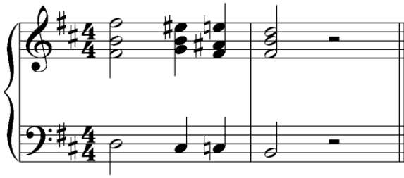
Транспонирующая вниз на б.2