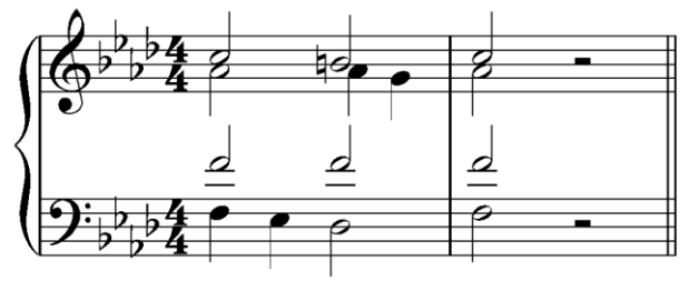
Транспонирующая вверх на б.2