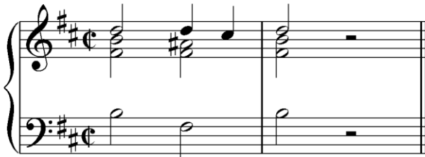
Транспонирующая вниз на б.2